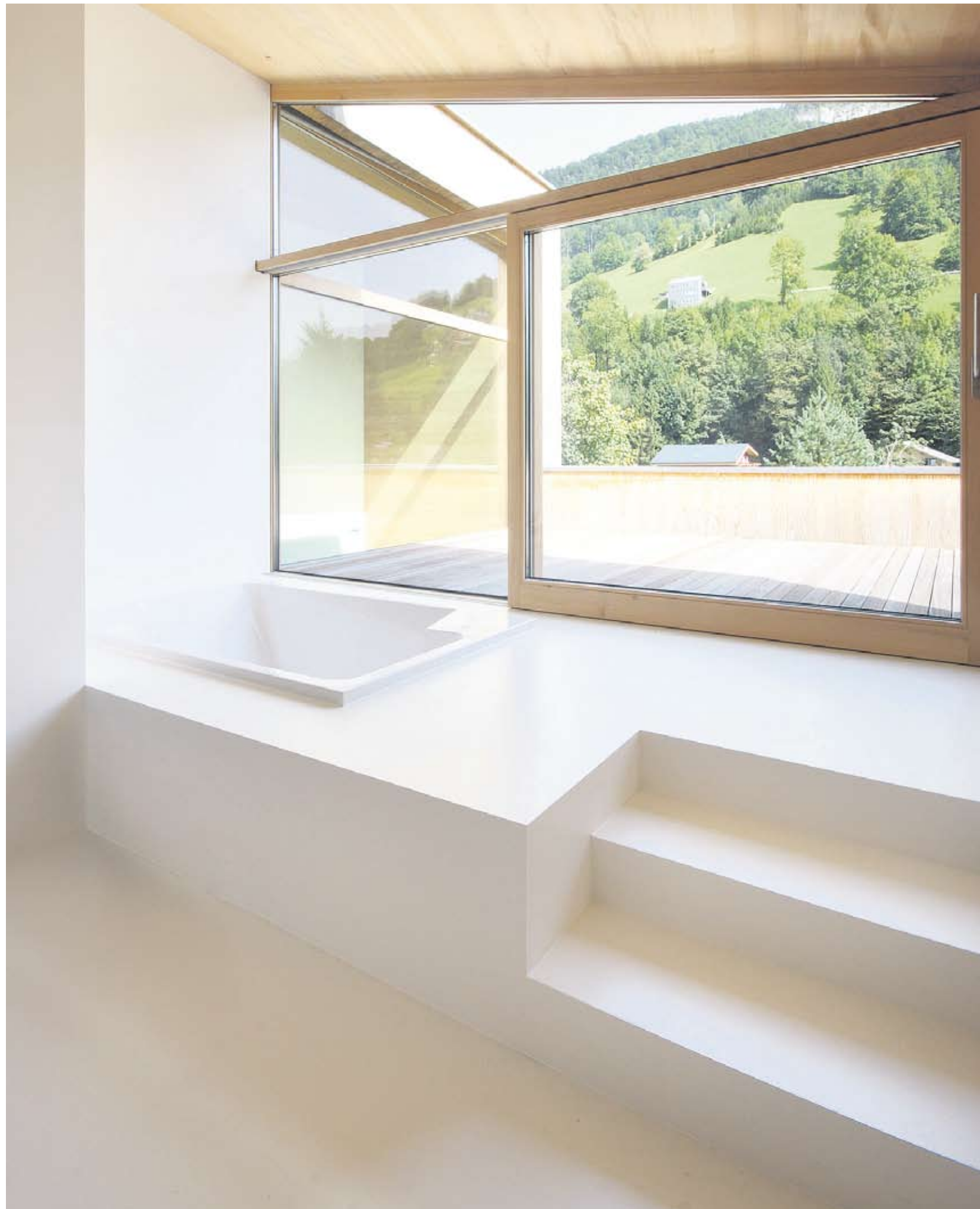
Das Highlight: Die eingelassene Duo-Badewanne mit Zugang zur Terrasse.