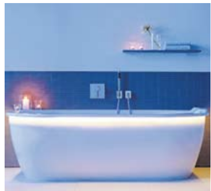
Passendes Licht sorgt für Stimmung im Bad.