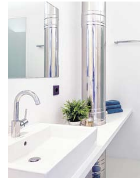
Geradlinigkeit und großzügige Waschtische findet man auch im Kinderbad.

Das lichtdurchflutete Bad, das sich im Obergeschoss befindet und einen direkten Zugang auf die Terrasse hat, wirkt auf den ersten Blick wie aus einem Guss. Die Böden in den Nasszellen sind mit dem Kunststoffmaterial Epoxidharz beschichtet und die Verkleidung der Badmöbel wurde aus weißen Schichtstoffplatten maßgefertigt – Glaselemente statt Fliesen findet man in der Dusche. „Das Bad hatte ich auf dem Papier schon fix und fertig entworfen. Bei Inhaus wurde ich anschließend kompetent beraten, welche Produkte am besten zu meinem Raumkonzept passen“, so Haller, der sich freut, dass er seine eigenen Ideen mit Inhaus 1:1 umsetzen konnte. Der anschließende Einbau der Sanitäreinrichtungen wie die Duo-Badewanne,