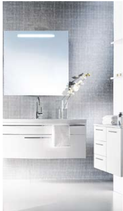
Dauerbrenner: Helles Licht bei Spiegeln im Badezimmer.