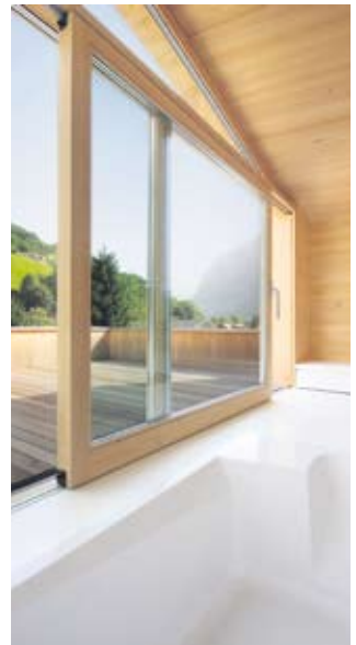
Vom Bad in die Natur: Einzigartiger Ausblick auf die Kanisfluh.

die beiden Waschtische mit form-schönen Armaturen, die großzügige Dusche und die WC-Anlage, wurden vom Inhaus-Partnerfachbetrieb, Siegfried Steuer Installationen aus Andelsbuch, vorgenommen.